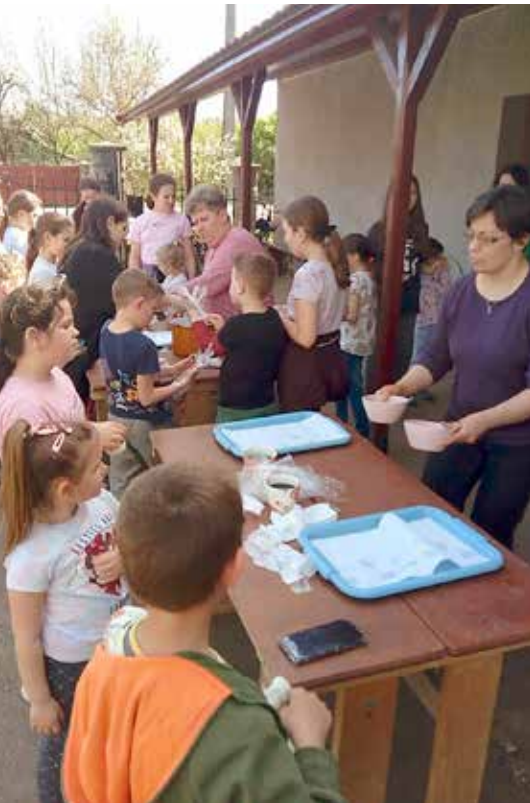
Kinderen in Janka

Het is altijd verrassend in Roemenië te komen. De mensen zijn altijd erg vriendelijk en gastvrij! Ook is het fijn dat heel veel mensen erbij betrokken zijn, de gemeenschappen zijn altijd actief en behulpzaam. Ook zijn ze niet groot. Je bent altijd welkom! Helaas is de armoede vergeleken bij ons verschrikkelijk hoog. Met mensen die gezond zijn en een eigen tuintje hebben gaat het redelijk. Anders.....?!