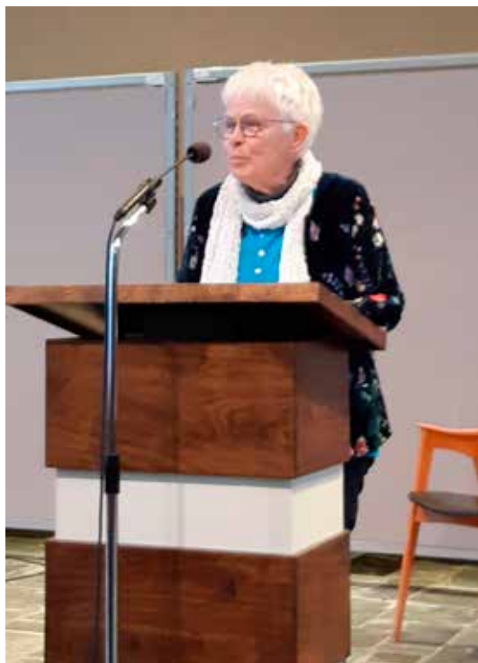
... Zo moeder, zo dochter ...