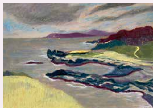
Illustratie Esra Post