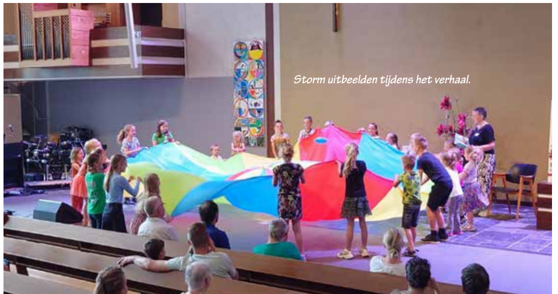
Storm uitbeelden tijdens het verhaal.