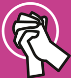
Illustratie: Linda Verholt

Bron: www.petrusprotestantsekerk.nl/ Leeuwarder Courant