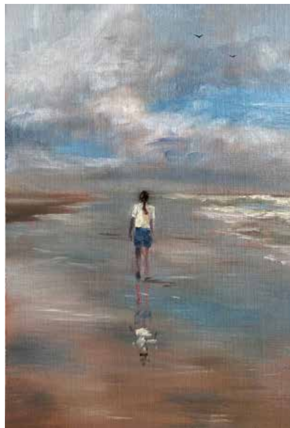
Schilderij van Esra Post