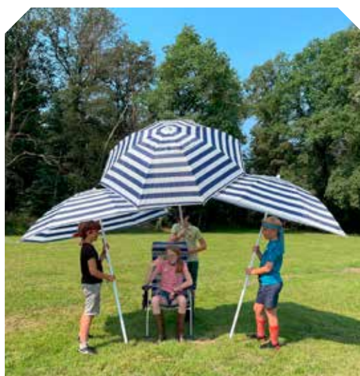
Bij foto 10

We hebben twee verschillende foto's. Op de eerste foto is iedereen voor zichzelf, apart. En dan moet je geloven in jezelf. Op de tweede foto zie je dat we lekker aan het spelen zijn met z'n allen. En dat is eigenlijk het tegenovergestelde van de eerste foto. We zijn met elkaar en we vertrouwen in elkaar en we hebben plezier. Door dingen met anderen te doen, voelen we ons verbonden met elkaar.