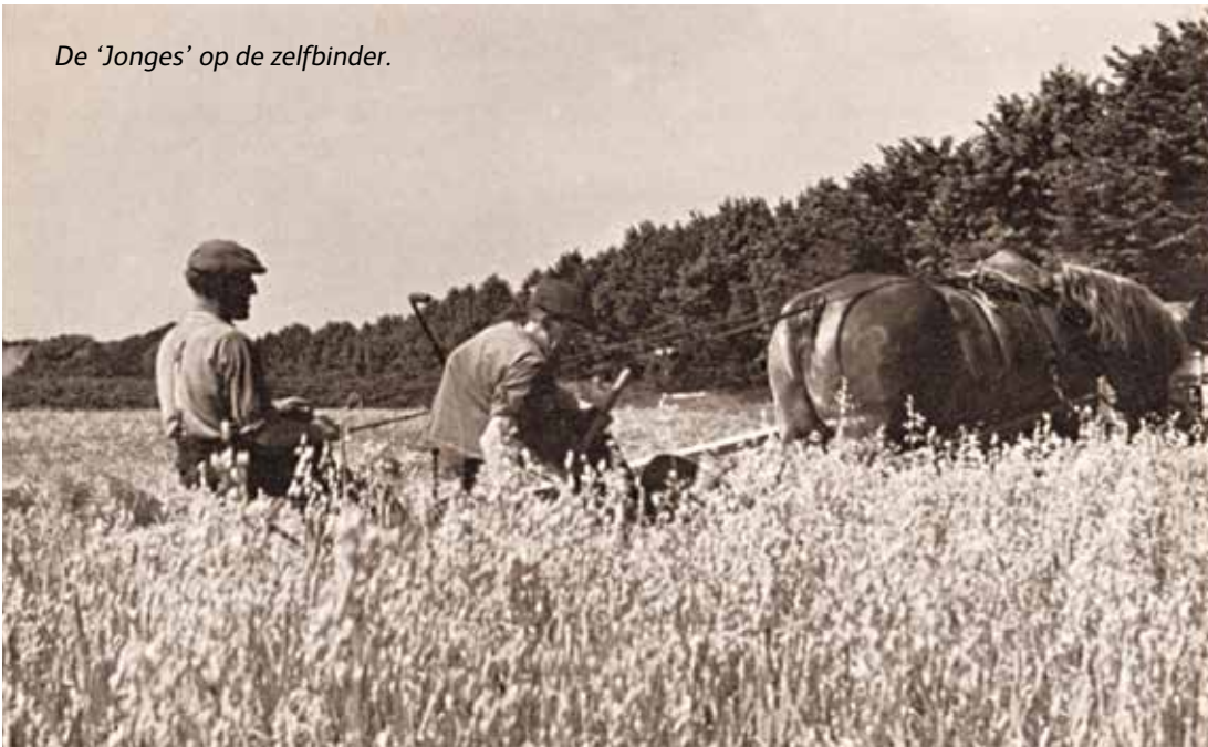
De 'Jonges' op de zelfbinder.