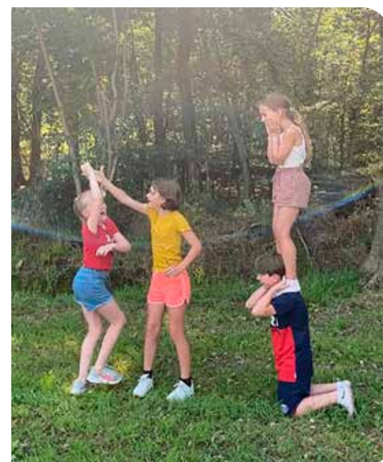
Bij foto 17 en 18 >>

Wij geloven in vrijheid en dat iedereen vrijheid moet hebben. Vroeger, in de Tweede Wereldoorlog, hadden we geen vrijheid. En we moeten dankbaar zijn dat we dat nu wel hebben.