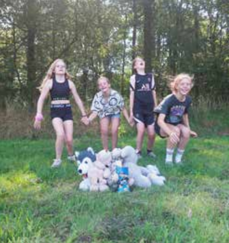
Bij foto 9

Wij hebben het gehad over jezelf mogen zijn en vertrouwen in jezelf. Dat je met anderen plezier mag hebben en hen mag vertrouwen. Dat je het fijn hebt op een mooie plek in de natuur en over gezond leven. Het belangrijkste is dat je jezelf mag zijn en dat je in jezelf gelooft, op jezelf vertrouwt.