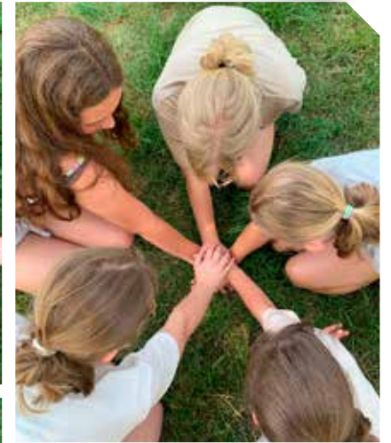
Bij foto 6, 7 en 8

Wij geloven in elkaar. Ook al kennen we elkaar nog maar één dag. Doordat we al veel leuke dingen samen hebben gedaan, kennen we elkaar al best goed. We kunnen elkaar vertrouwen en dat is heel fijn. En het is fijn als anderen jou vertrouwen. Want dan kun je goed met elkaar praten en lachen.