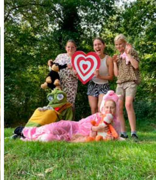
Bij foto 15 en 16

We hebben twee verschillende foto's. Op de eerste foto is iedereen voor zichzelf, apart. En dan moet je geloven in jezelf. Op de tweede foto zie je dat we lekker aan het spelen zijn met z'n allen. En dat is eigenlijk het tegenovergestelde van de eerste foto. We zijn met elkaar en we vertrouwen in elkaar en we hebben plezier. Door dingen met anderen te doen, voelen we ons verbonden met elkaar.