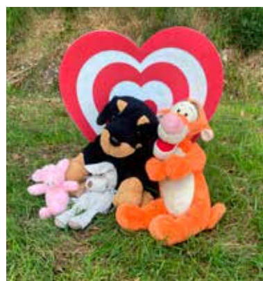
Bij foto 11, 12 en 13

Wij hebben het gehad over jezelf mogen zijn en vertrouwen in jezelf. Dat je met anderen plezier mag hebben en hen mag vertrouwen. Dat je het fijn hebt op een mooie plek in de natuur en over gezond leven. Het belangrijkste is dat je jezelf mag zijn en dat je in jezelf gelooft, op jezelf vertrouwt.