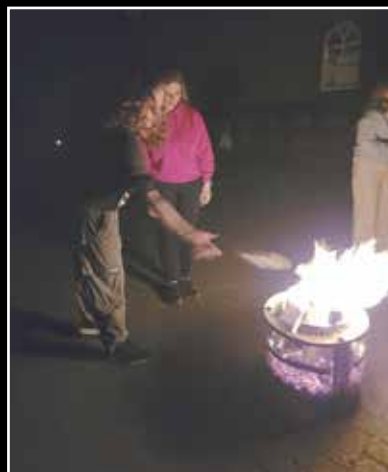
De dingen die we los wilden laten werden in het vuur gegoid

Bij de eerste stop aan de Brassendijk was het thema: Waar zeg je nee tegen? En waar ga je van stralen? Iedereen dacht na over welke dingen hij of zij los zou willen laten. Deze dingen werden opgeschreven en in het vuur gegoid. Daarna dacht iedereen na over waar hij of zij van ging stralen, en daar werd een lichtfoto van gemaakt.