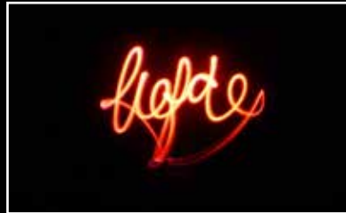
Waar ga je van stralen?