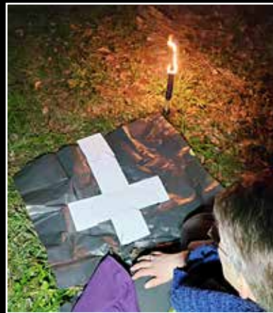
Godly Play. het mysterie van Pasen

Het thema op deze locatie was dan ook niet voor niets: Anders dan verwacht.