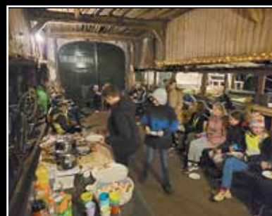
Een heerlijke maaltijd

Na deze eerste stop liepen we verder naar Sinderen, waar we in de huifkar stapten en naar Halle reden. Ook hier werden we zeer gastvrij ontvangen en konden we genieten van een heerlijke maaltijd. Na het eten leerden we elkaar wat beter kennen rond het vuur, passend bij het thema van deze locatie: Een bijzondere ontmoeting. De (huifkar)tocht ging verder naar Westendorp. Hier was het thema: