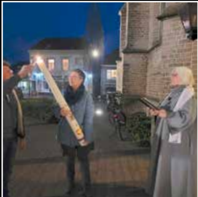
De nieuwe paaskaars wordt aangestoken

In de paasnacht hebben zo'n twintig tieners uit Aalten, Varseeveld, Halle, Silvolde en Dinxperlo de paaswandelmwake gelopen. Het thema van deze nacht was 'Verander je mee?' De hele nacht waren we wakker, de hele nacht waren we op pad. Deels lopend, deels met een huifkar, gingen wij van Aalten naar Lintelo, Halle, Westendorp, Silvolde en Dinxperlo.