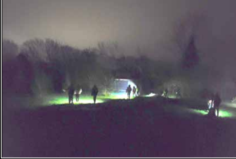
Zoekspel in het donker

zie je gelukkig ook genoeg positieve dingen. We speelden een zoekspel in het donker, waarbij het de bedoeling was om zo snel mogelijk alle positieve tegenhangers van negatieve dingen te vinden.