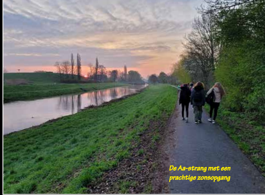
De Aa-strang met een prachtige zonsopgang

Het thema op deze locatie was dan ook niet voor niets: Anders dan verwacht.