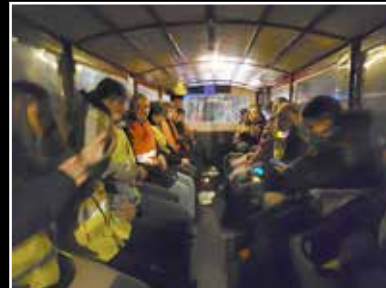
In de huifkar naar Halle

Bij de eerste stop aan de Brassendijk was het thema: Waar zeg je nee tegen? En waar ga je van stralen? Iedereen dacht na over welke dingen hij of zij los zou willen laten. Deze dingen werden opgeschreven en in het vuur gegoid. Daarna dacht iedereen na over waar hij of zij van ging stralen, en daar werd een lichtfoto van gemaakt.