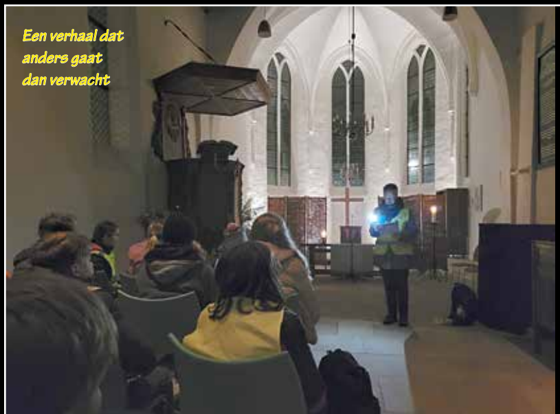
Een verhaal dat anders gaat dan verwacht