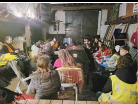
De eerste stop aan de Brassendijk

Met het licht van de paaskaars, de zegen en proviand voor onderweg gingen wij de donkere nacht in. Op de verschillende locaties, bij enthousiaste, gastvrije gemeenteleden aan huis, was er steeds een activiteit. Lerend over het paasverhaal liepen wij het licht tegemoet.