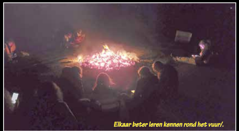
Elkaar beter leren kennen rond het vuur/.