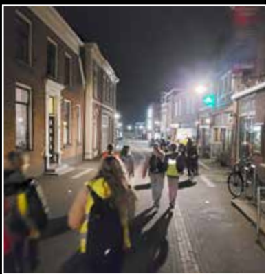
De donkere nacht in ...

In de paasnacht hebben zo'n twintig tieners uit Aalten, Varseeveld, Halle, Silvolde en Dinxperlo de paaswandelmwake gelopen. Het thema van deze nacht was 'Verander je mee?' De hele nacht waren we wakker, de hele nacht waren we op pad. Deels lopend, deels met een huifkar, gingen wij van Aalten naar Lintelo, Halle, Westendorp, Silvolde en Dinxperlo.