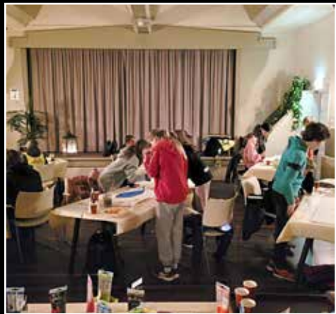
Schilderen, anders dan verwacht.