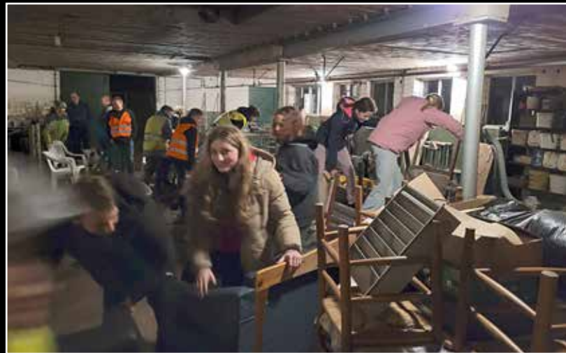
Op zoek naar paaseieren

Van Westendorp reden we door naar Sinderen. In de kerk stonden we stil bij het verhaal van de Stille Week. Een verhaal waarbij het steeds anders gaat dan verwacht: van feest naar verdriet naar weer feest. Ook in ons eigen leven gaat het soms anders dan verwacht. Vaak kun je daar niets aan doen, het is zoals het is en je zult er iets van moeten maken. Dat ontdekten we ook met de opdracht die we kregen. Net voordat de tieners aan een schilderij over de belevissen van de nacht wilden beginnen, werd er met een zwarte stift een kras op het doek gezet ... Anders dan verwacht, maar het is was het is. Aan de tieners de opdracht om er toch nog iets van te maken.